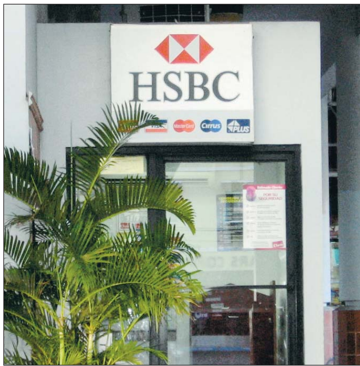
En el 2006, el HSBC contaba ya con 110 oficinas “exprés”, en las que los clientes son recibidos en la puerta por un gestor.

con 48 sucursales en las que también aplica esta norma, pero todas ellas están situadas en zonas apartadas de las sucursales habituales.